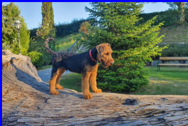
Neugierig auf die Welt!

Wir wissen, dass jedes Mensch-Hund-Team einzigartig ist. Deshalb streben wir danach, uns individuell auf Ihre Bedürfnisse und Interessen einzustellen.