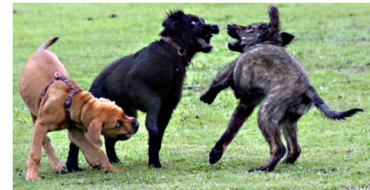
Welpen im Spiel

Der Weg dorthin: spielerisch und motivierend für die Hunde – konsequent seitens der HundeführerInnen. Gemeinsam meistern wir diese Herausforderung.